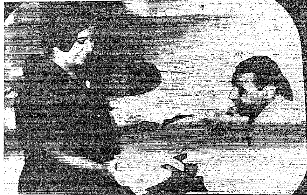
سمو الاميرة بسملة توزع الهدايا على المرضى في المستشفيات. وهو مشهد من اعمال سوها الخيرية عرشة القنصلون الاردني بمناسبة عيد ميلادها

المطلة المحلة - خاص بالسنور - استوفت القوات الإسرائيلية على كيان شاطئ العريش التي كانت تستخدم للتصنيف، وقاموا بإصلاح الهدم بها، وعمروا كازينو على البحر، وبدأت الحفلات اليهودية ترناد المصيف المشهور بأعداد متزايدة.